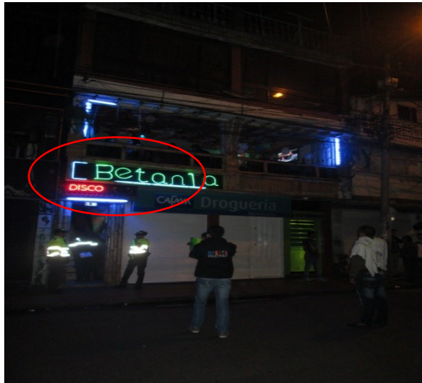
Fotografía No. 1: Visita de requerimiento al establecimiento.